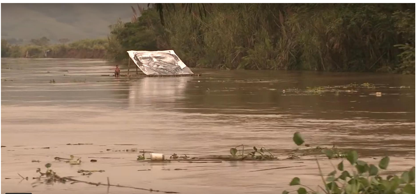
Installation, Fleuve Magdalena, Colombie